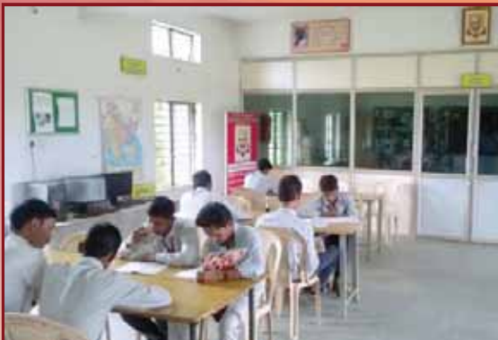
Reading Room of Library