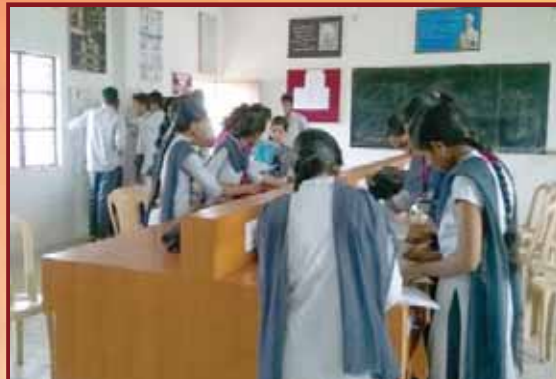
Students Performing in laboratory