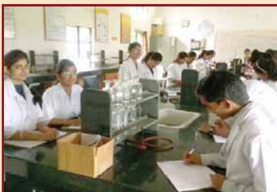
Students Performing in laboratory