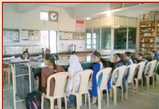
Students Performing in laboratory