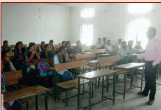
Placement Cell Activity